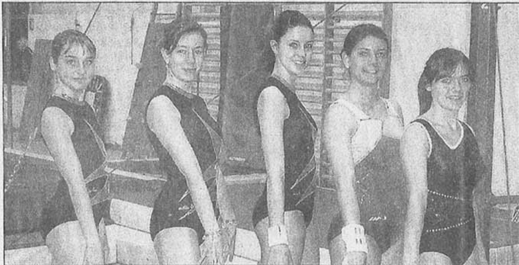
Une partie des athlètes nominés.

Ce samedi 1 er mars, tout le monde sportif l'islois s'est retrouvé à la salle des fêtes pour la 6 e nuit des Roues d'or