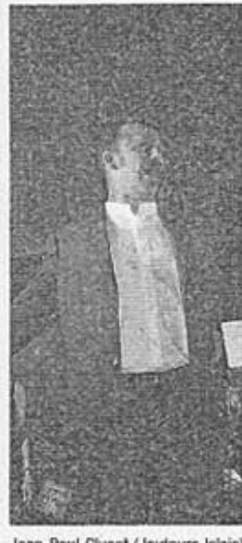
Jean-Paul Cluset (Jouteurs Islois) un lauréat euphorique.