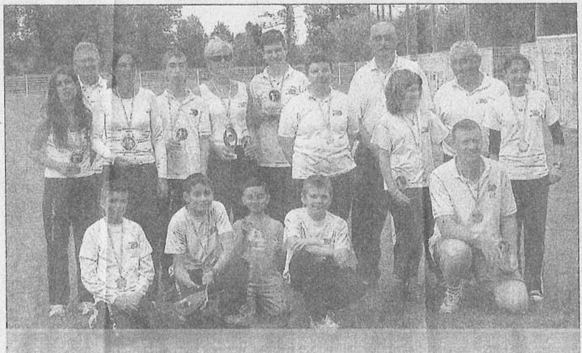
Le groupe des compétiteurs reprendra la saison début septembre. Avec l'envie de faire aussi bien.

La saison prochaine, 2 tournois en salle sont prévus (les 13 et 14 décembre 2008, et les 31 janvier et 1 er février 2009), participation au tournoi Européen de Nîmes, etc. L'objectif pour la nouvelle saison sera d'obtenir le label Argent auprès de la Fédération Française de Tir à l'Arc. □