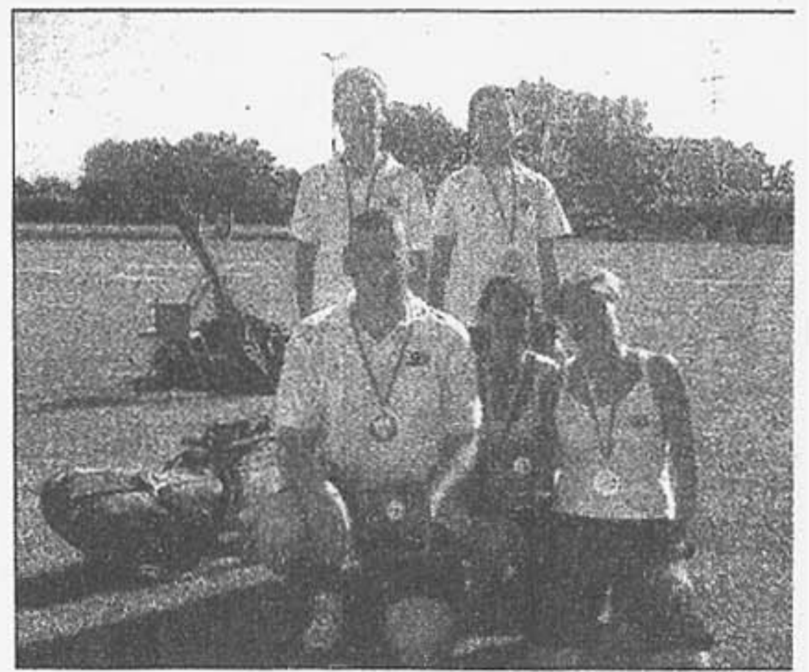
Les médaillés de Morières. Le VAUCLUSE 25/0