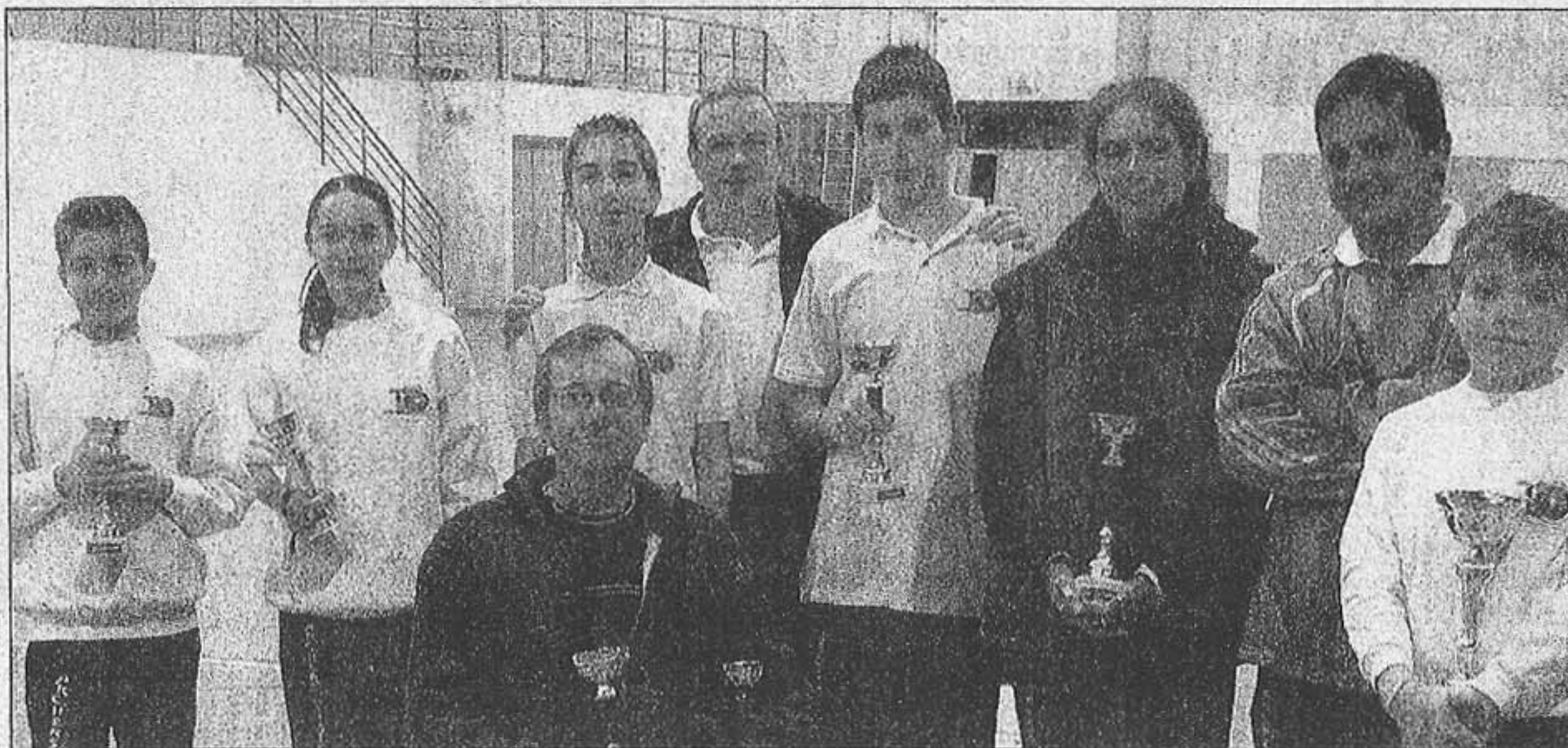
Les archers présents à Aramon.

Les archers islois étaient en déplacement, ce week-end.